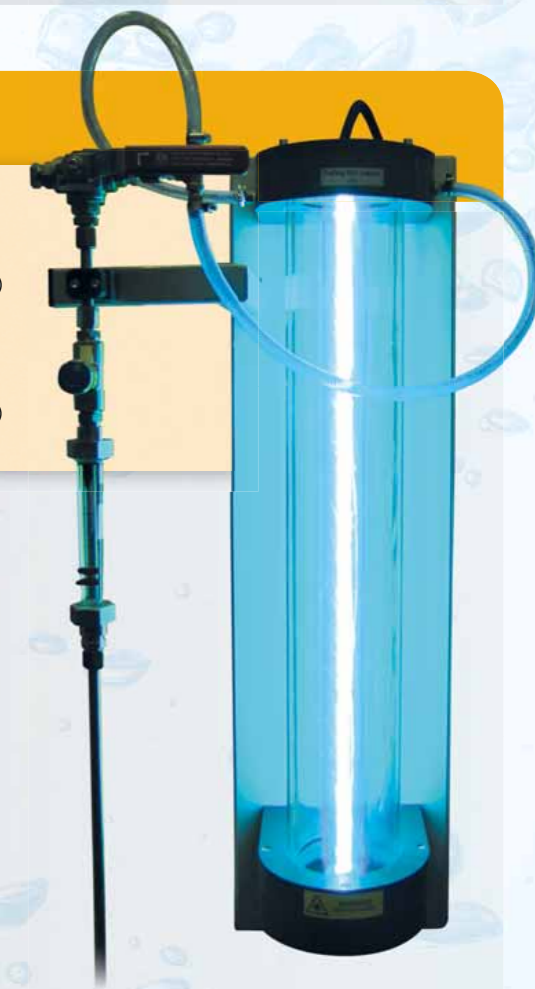
CE 584 Oxydation avancée