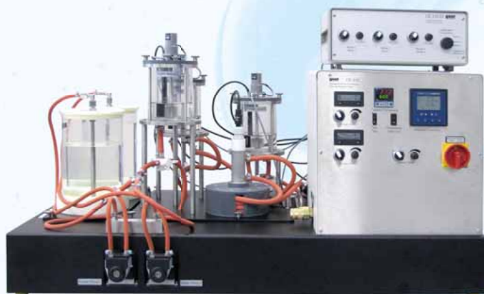
Unité d'alimentation pour les réacteurs chimiques CE 310 avec Cascade de cuves agitées CE 310.03

Les matières de départ sont transformées à l'aide de micro-organismes, cellules ou enzymes. Étant donné les conditions bien particulières de ces réactions, le génie des procédés biologiques est devenu une discipline à part entière.