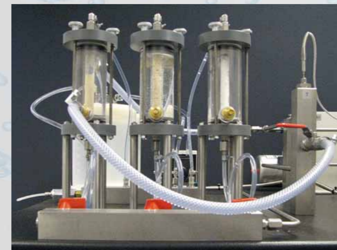
CE 380 Catalyse à lit fixe