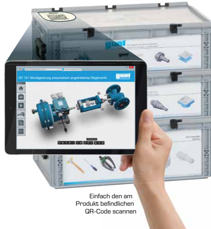
Einfach den am Produkt befindlichen QR-Code scannen

Nach Auswahl des Produkts kann der Kunde wahlweise die Zusammenbauzeichnung, Zeichnungen der Baugruppen oder Einzelteilzeichnungen ansehen oder herunterladen. Montage- und Demontagevideo sowie Stücklisten und Anleitungen sind verfügbar.