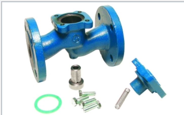
Soupape de retenue, démontée