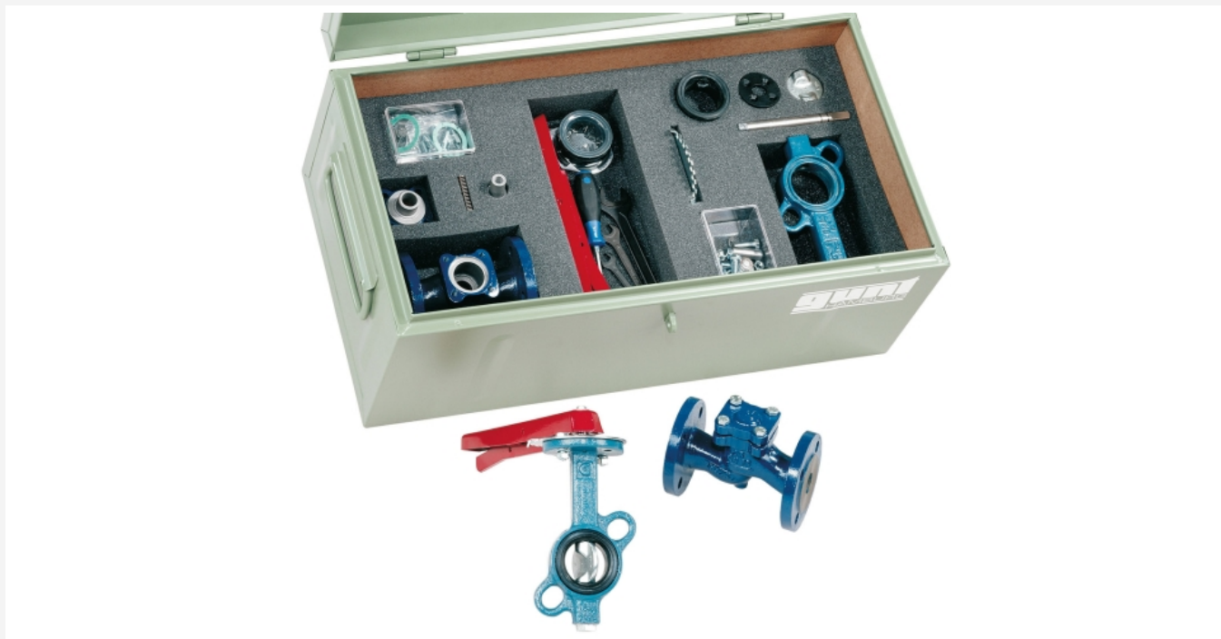
L'illustration montre la caisse à outils avec les kits et les outils, à l'avant-plan la robinetterie assemblés à partir des kits.