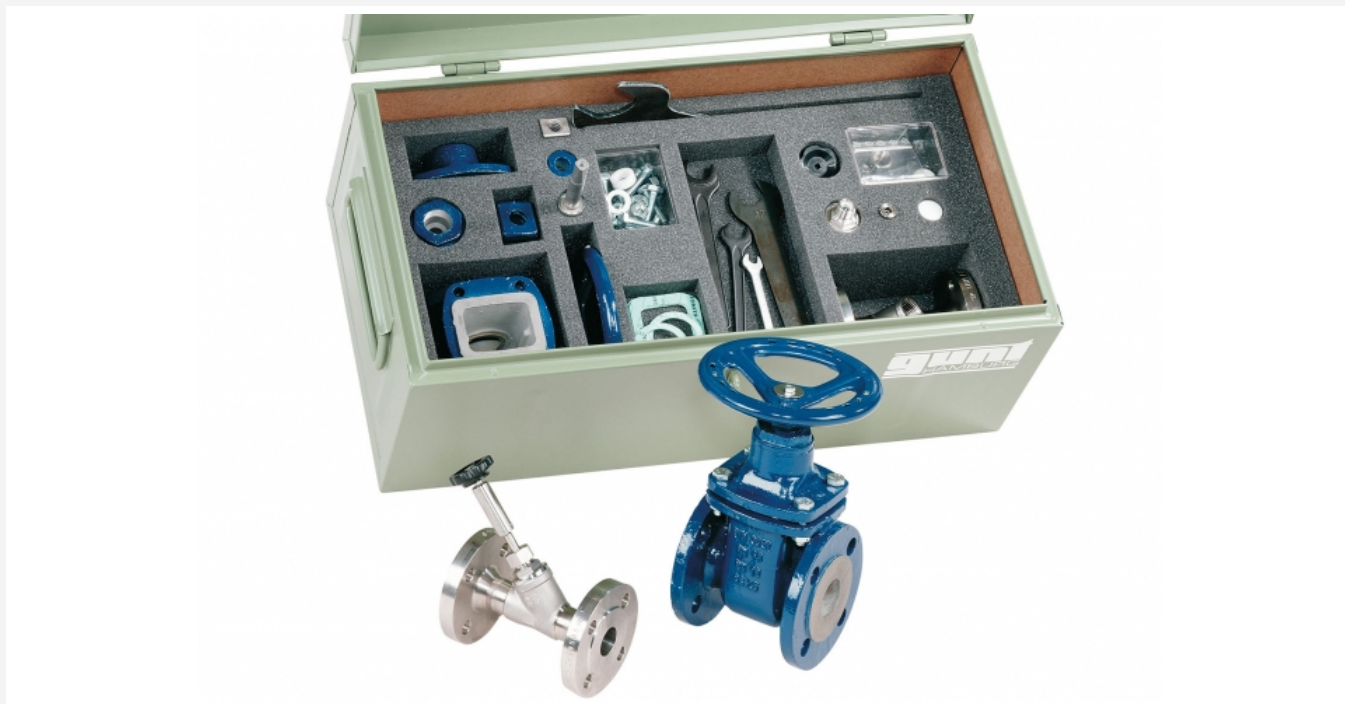
Die Abbildung zeigt die Werkzeugkiste mit den Bausätzen und Werkzeugen, im Vordergrund die Armaturen, wie sie sich aus den Bausätzen montieren lassen.