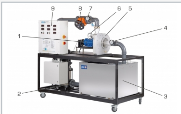
1 máquina asíncrona, 2 bomba, 3 depósito, 4 indicador de presión en la salida de la turbina, 5 turbina, 6 ajuste de los álabes distribuidores, 7 indicador de presión en la entrada de la turbina, 8 válvula de estrangulación, 9 armario de distribución con elementos de indicación y mando