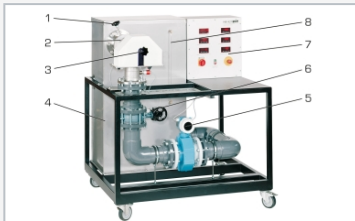
1 palanca para ajustar los álabes distribuidores, 2 turbina de hélice, 3 freno, 4 depósito con bomba sumergible, 5 caudalímetro, 6 volante de mano para válvula de mariposa, 7 armario de distribución, 8 indicador de nivel de llenado del depósito