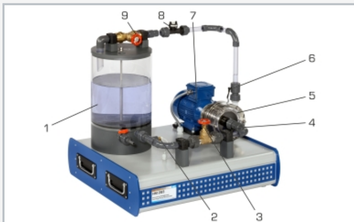
1 réservoir d'eau, 2 capteur de température, 3 soupape à l'entrée, 4 capteur de pression à l'entrée, 5 pompe, 6 capteur de pression à la sortie, 7 moteur, 8 capteur de débit, 9 soupape à la sortie