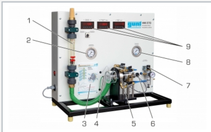
1 rotámetro, 2 manómetro en la salida, 3 tabla de información, 4 sensor de temperatura, 5 turbina, 6 volante de mano de freno de corrientes parásitas, 7 válvula de desahogo de presión con filtro, 8 manómetro en la entrada, 9 elementos de indicación