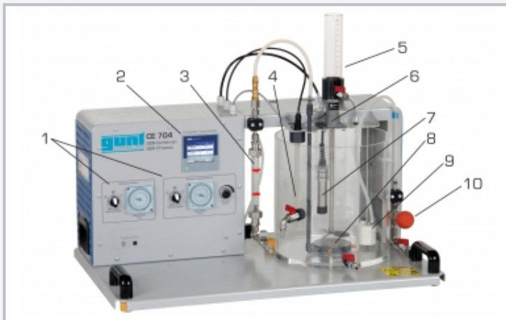
1 Bedienelemente für den Verdichter und für das Rührwerk, 2 Prozessregler, 3 Durchflussmesser (Luft), 4 pH-Wert-Aufnehmer, 5 Dosiervorrichtung, 6 Rührwerk, 7 Sauerstoffaufnehmer, 8 Belüftungsvorrichtung, 9 Schwimmer für Klarwasserabzug, 10 Ansaugball für Klarwasser