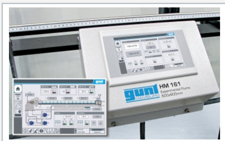
Touchpanel frei positionierbar