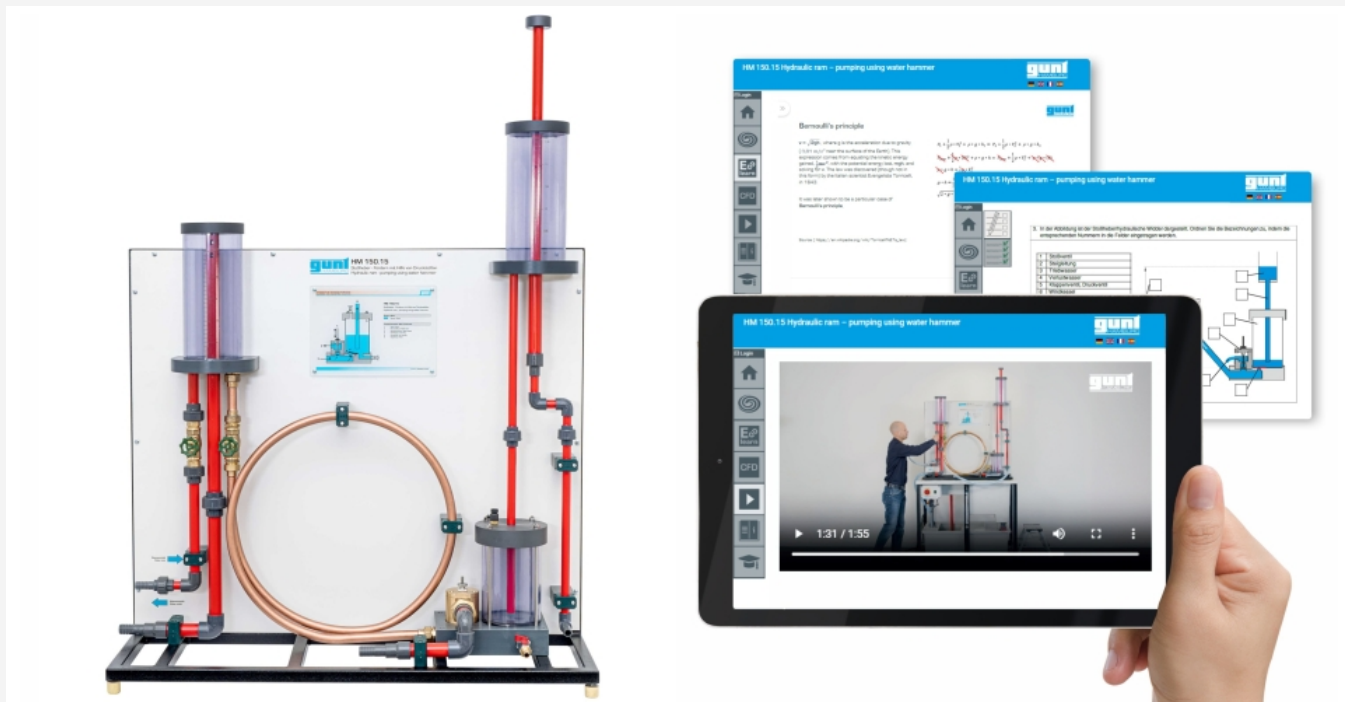
La ilustración muestra el dispositivo y el GUNT Media Center, tablet no incluida