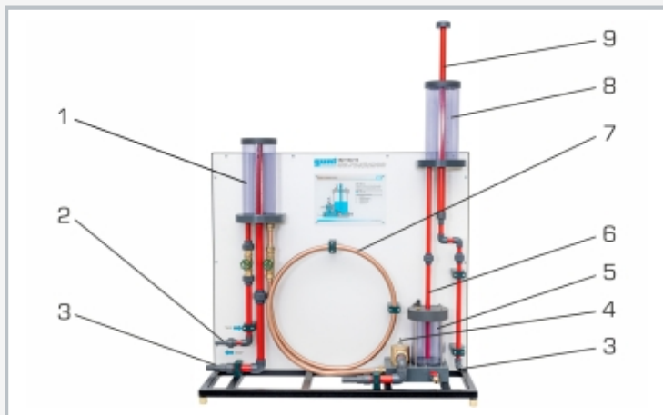
1 depósito afluencia con rebose fijo, 2 toma de agua, 3 desagüe, 4 válvula de descarga con carrera, 5 cámara de aire con volumen de aire y chapaleta de retención, 6 columna ascendente, 7 tubería, 8 depósito elevado, 9 rebose ajustable