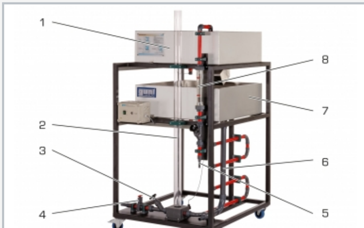
1 Becken A mit verstellbarem Wehr, 2 Wasserschloss, 3 Ventil in der Abflussleitung, 4 Schieber zur Erzeugung von Druckstößen, 5 Wasseranschluss, 6 Überlaufleitung, 7 Becken B mit Überlauf, 8 Durchflussmesser