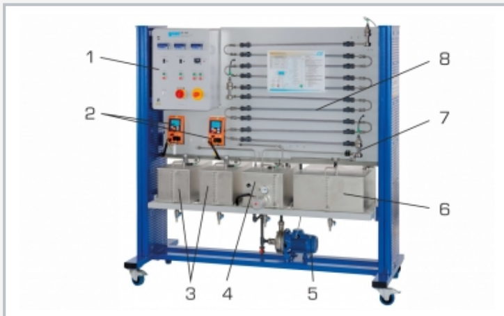
1 Schaltschrank, 2 Eduktumpfen mit Volumenstrommessung, 3 Eduktbehälter, 4 Warmwasserbehälter, 5 Pumpe, 6 Produktbehälter, 7 Messung von Temperatur und elektrischer Leitfähigkeit, 8 Strömungsrohrreaktor mit 10 Abschnitten