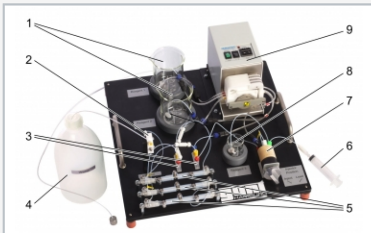
1 depósitos para reactivo A y B, 2 célula de caudal, 3 cámaras de mezclas, 4 desecho, 5 circuito de reacción, 6 jeringa de inyección, 7 válvula de inyección, 8 GOx, 9 bomba peristáltica multicanal