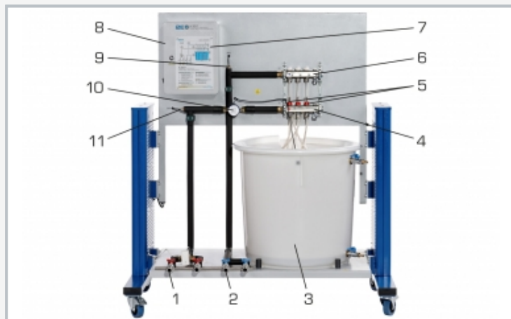
1 conexión para ida, 2 conexión para vuelta, 3 depósito para agua fría y caliente, 4 distribuidor de ida, 5 rotámetro, 6 distribuidor de vuelta, 7 tabla de información, 8 caja de toma de corriente para sensores de medición, 9 sensor de temperatura de vuelta, 10 rotámetro, 11 sensor de temperatura de ida