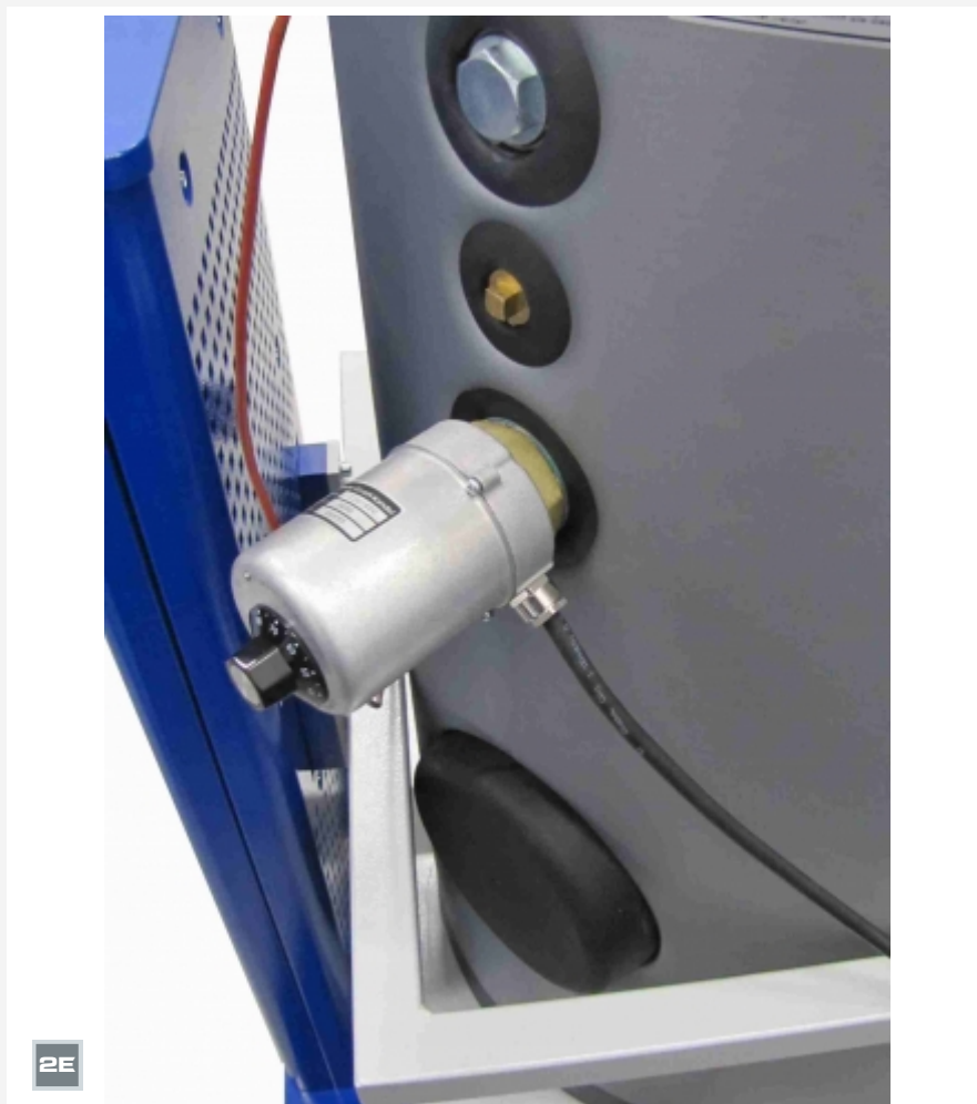
Dispositivo de calefacción HL 320.02 incorporada en el acumulador bivalente del HL 320.05