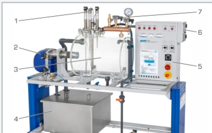
1 surveillance du niveau d'eau, 2 brûleur, 3 modèle de chaudière à vapeur, 4 réservoir d'alimentation, 5 armoire de commande, 6 coffret de commande pour des pannes, 7 dispositifs de mesure de la pression