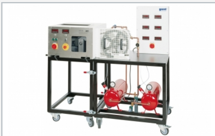
Die Abbildung zeigt einen vollständigen Versuchsaufbau von ET 513 und HM 365