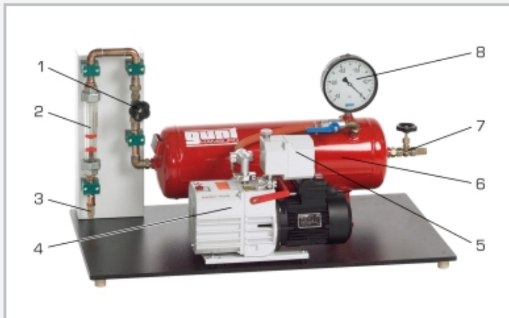
1 válvula de aguja, 2 caudalímetro, 3 silenciador, 4 bomba rotativa de paletas, 5 separador de aceite, 6 depósito a presión, 7 válvula de aguja con silenciador, 8 manómetro