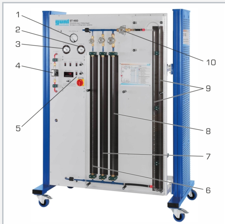
1 manómetro presión diferencial, 2 manómetro lado de presión, 3 manómetro lado de aspiración, 4 caudalímetro, 5 elementos de indicación y mando, 6 columna ascendente Ø 6mm, 7 columna ascendente Ø 10mm, 8 columna ascendente Ø 14,4mm, 9 columna ascendente doble, 10 válvula para la selección de la columna ascendente