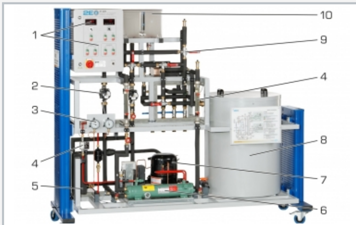
1 Anzeige- und Bedienelemente, 2 Pumpe, 3 Manometer, 4 Durchflussmesser, 5 Verdampfer, 6 Verflüssiger, 7 Verdichter, 8 Eisspeicher, 9 3-Wege-Ventil, 10 Ausgleichsbehälter (Glykol-Wasser-Gemisch)