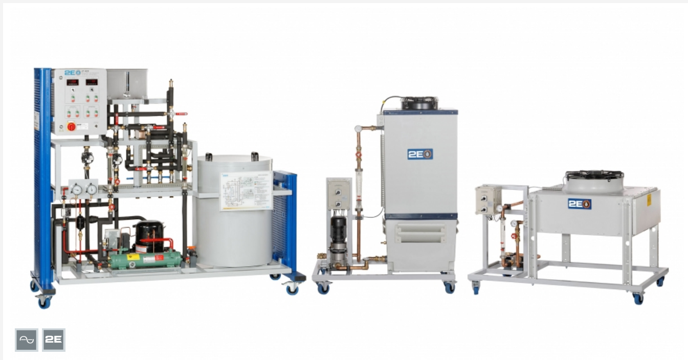
Die Abbildung zeigt den Versuchsstand links, Nasskühlturm in der Mitte und Trockenkühlturm rechts.