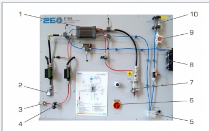
1 pile à combustible, 2 ventilateur de la cathode, 3 soupape de décharge basse pression, 4 soupape d'entrée, 5 pompe à eau de refroidissement, 6 interrupteur principal, 7 séparateur d'eau, 8 refroidisseur d'eau, 9 contrôle de débit visuel, 10 réservoir d'eau de refroidissement