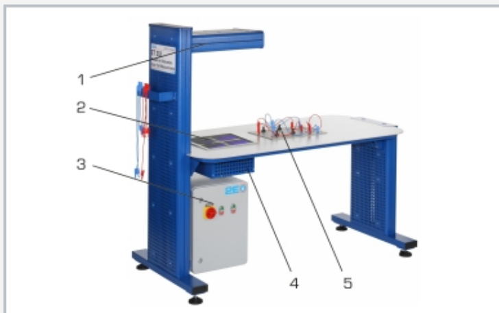
1 unidad de alumbrado, 2 cuatro células solares de silicio monocristalino, 3 unidad de control, 4 módulo Peltier, 5 panel de conexión