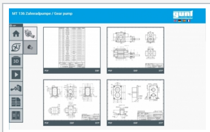
Capture d'écran du GUNT Media Center