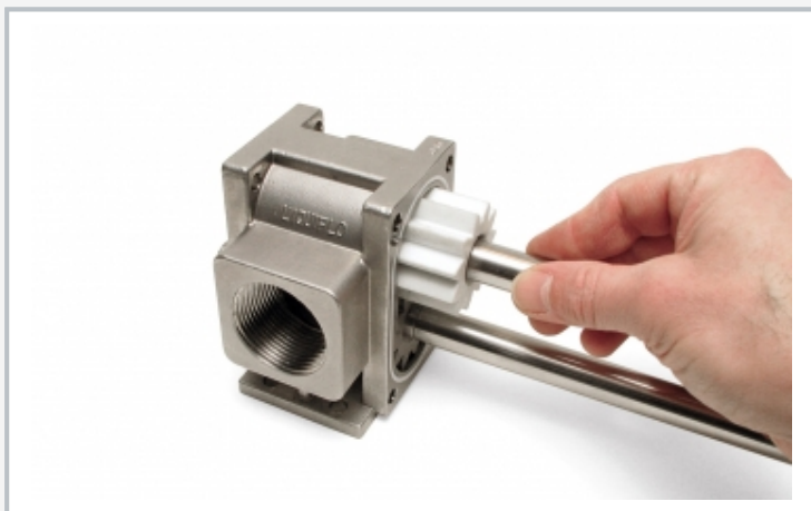
Montage de la pompe à engrenages: monter l'arbre d'entraînement