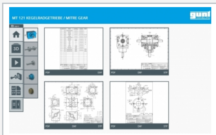
Capture d'écran du GUNT Media Center