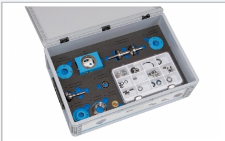
MT 121: système de rangement avec mousse de protection, tous les composants ont leur place fixe, la mousse est étiquetée