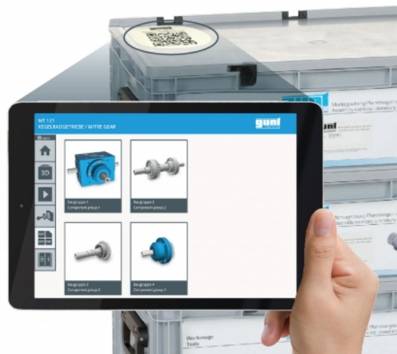
L'illustration montre l'engrenage monté et le GUNT Media Center sur une tablette (non comprise)