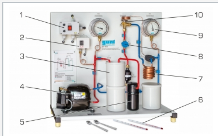
1 interruptor principal, 2 presostato, 3 condensador con depósito de agua, 4 compresor, 5 recipiente, 6 termómetro, 7 evaporador, 8 mirilla (refrigerante), 9 manómetro, 10 válvula de expansión