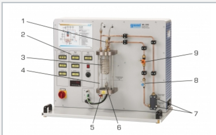
1 válvula de seguridad, 2 indicaciones para temperatura, caudal y presión, 3 condensador, 4 depósito a presión, 5 válvula de purga para líquido a evaporar, 6 dispositivo de calefacción, 7 conexión para agua de refrigeración, 8 válvula para ajustar el agua de refrigeración, 9 sensor de caudal para agua de refrigeración