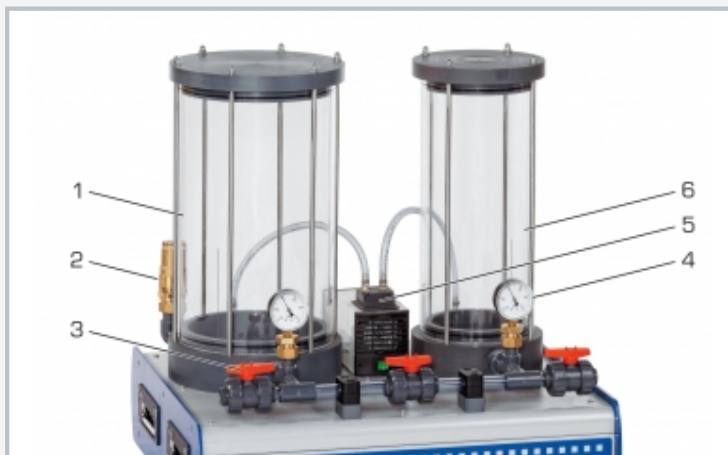
1 réservoir en surpression, 2 soupape de sécurité, 3 robinet à tournant sphérique, 4 manomètre, 5 compresseur, 6 réservoir en dépression