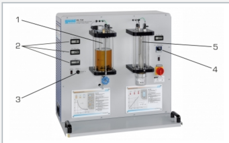
1 depósito 1 para cambio de estado isotérmico, 2 indicadores digitales, 3 cambiar entre compresión/expansión a válvula de 5/2 vías, 4 regulador de calefacción, 5 depósito 2 para cambio de estado isocórico