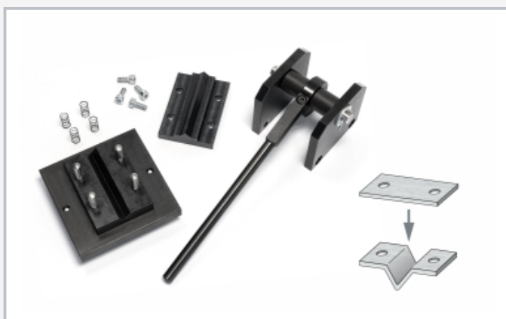
Biegepresse zerlegt in Funktionsgruppen: Oberstempel (Hub), Gestell, Hebel, rechts das Produkt der Biegepresse