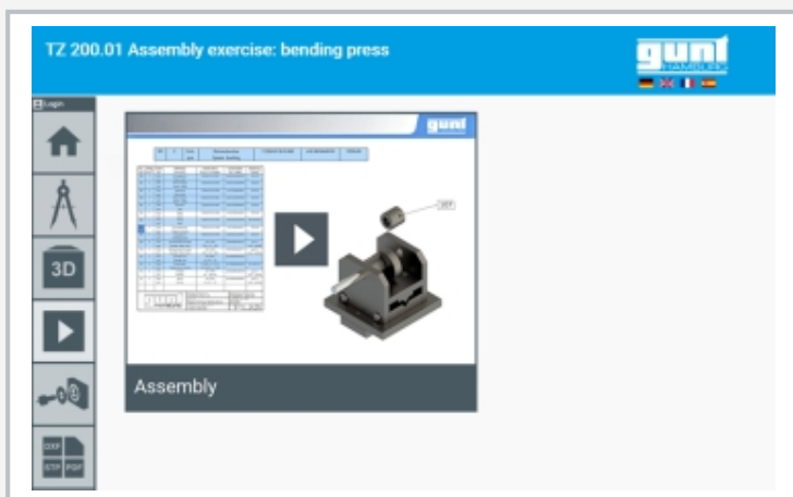
Screenshot des GUNT Media Centers: Montagevideo