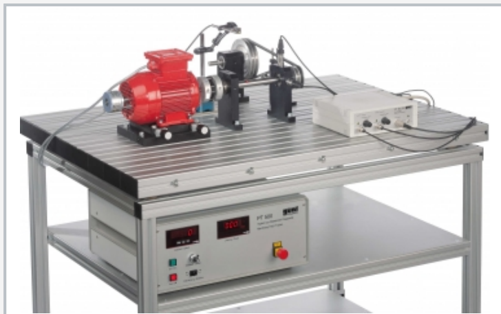
L'illustration montre le PT 500.12 avec PT 500, PT 500.01, PT 500.14 et PT 500.04.