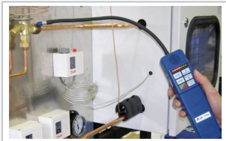
Contrôle d'étanchéité sur la soupape de détente de l'installation entièrement montée