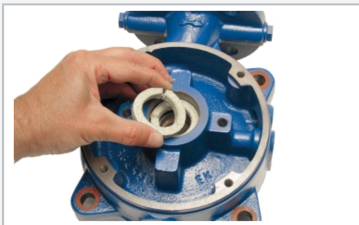
Montage de la pompe centrifuge à 4 étages: monter les bagues presse-étoupe