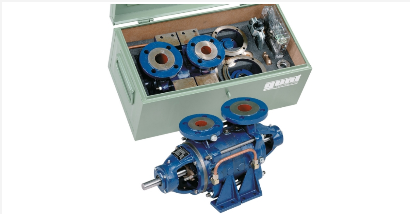
L'illustration montre la caisse à outils avec le kit et le jeu d'outils et, à l'avant-plan, la pompe complètement montée.