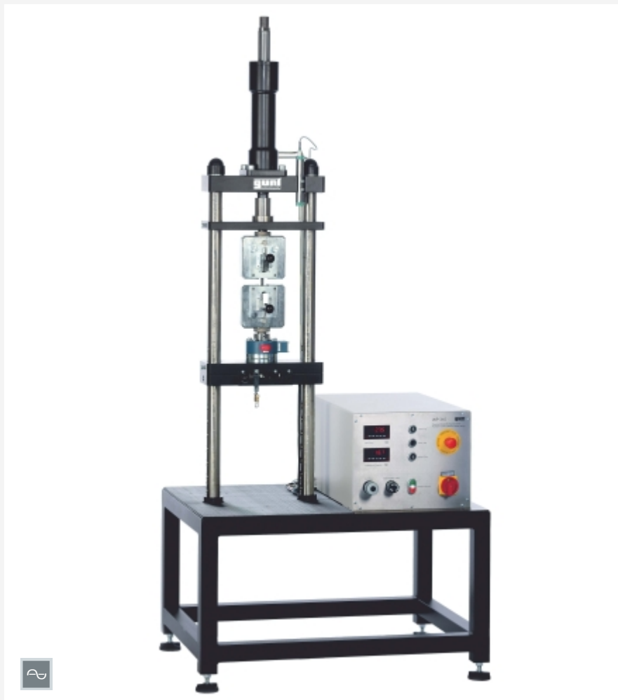
L'illustration montre le WP 310 avec l'accessoire WP 310.05.